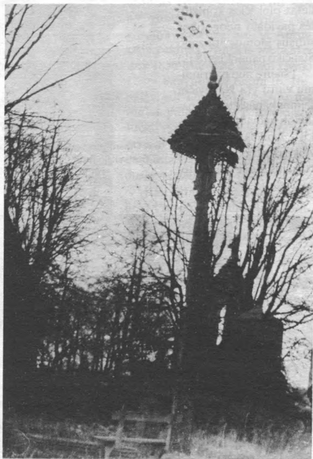
9 il. Generolo V. Nagevičiaus pastatytas stogastulpis prie motinos Marijos Magdalenos Nagevičienės kapo.

1963 m. (KMF Nr. 13353).