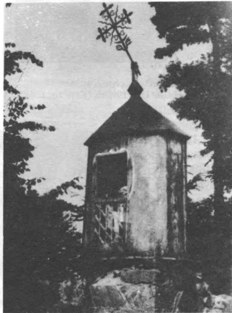
2 il. Buvusi kapinių tvoros koplytėlė (Lietuvos nacionalinio muziejaus fondai, neg. Nr. 13430; skelbta leidinyje „Lietuvių liaudies menas: Mažoji architektūra. – V., 1990. – Kn. 2.)