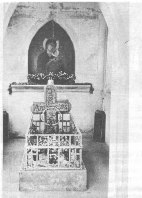
J. A. Pabrėžos kapas. 1849 m. 1962 m. (KMF Nr. 13115)