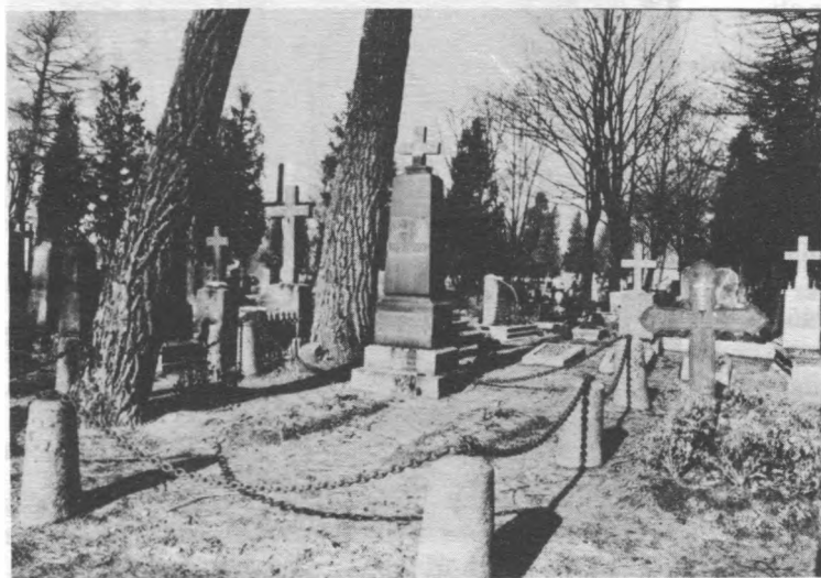
7 il. Bajorų Šalkauskių šeimos kapavietė.