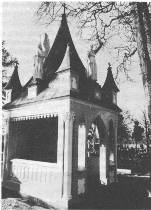
4 il. J. A. Pabrėžos paminklas koplytėlė. 1933 m. Fot. A. Lūža 1990 m. (KMF Nr. 16047)

Įdomūs mūsų kalbos raidai pažinti yra vienuolių ir pasauliečių antkapinių kryžių memorialiniai tekstai žemaičių tarme. Jie tuo labiau vertingi, kad lieti lietuviškos spaudos draudimo metais. Keletas iškalbingų užrašų: „Czionaj ylsas kunas Kuniga Odoryka Laurynawiczes zok. K. K. Bernardinu Kursaj pargiwenis ant swieta 57 metus pasimiry 9 die no Lapkryste mienese Ejnantin pro szali prasz sukaltbiety po 3 amzina atilsi“, „Stanislaus Jazdauskis Numyri Kaszutie Darbie nu parakwe metunsis 1830 mienese aprylie 15-a dieno Praszau sukaltbietie už duszy ano po trys Swejka Maryja“, „Cze ilsas kunas S. P. Juzapa Pawlawsky. Pargiwenys 76. metus mirus waseria 1872 metusy. Praejnatio prasz, kad ne užmyrsztu duszys jo“, „Czionaj Omzyns Atylsis Jozapa 1856 m. 31 Liepos, yr Weronikas 1874 m. 29 Kowa, Styrbawiczu Pakajus Jums Milausy Gimditoje“, „S. P. BARBORA LUNKUTALY Gimy 26. Waseria 1854 m. Numiry 4. Birzèle 1870 m. Ko werkat Tiewaj nemiry mergaity ale mikt. Pawadinta ira idant neteibes ne prazuditu duszys Jos“, „Diewów Duszy adawys Tal-