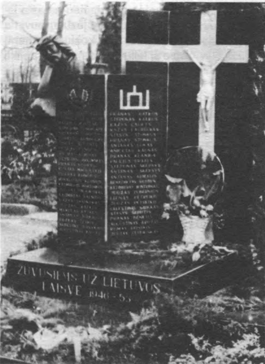
12 il. Paminklas žuvusiems už Lietuvos laisvę 1946–1953 metais (projekto autorius archit. E. Giedrimas).