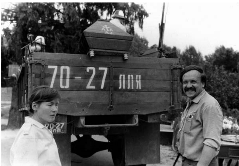
Ekspedicija Skuodo rajone, Ylakiuose. Kalčių kaimas. 1986 m.