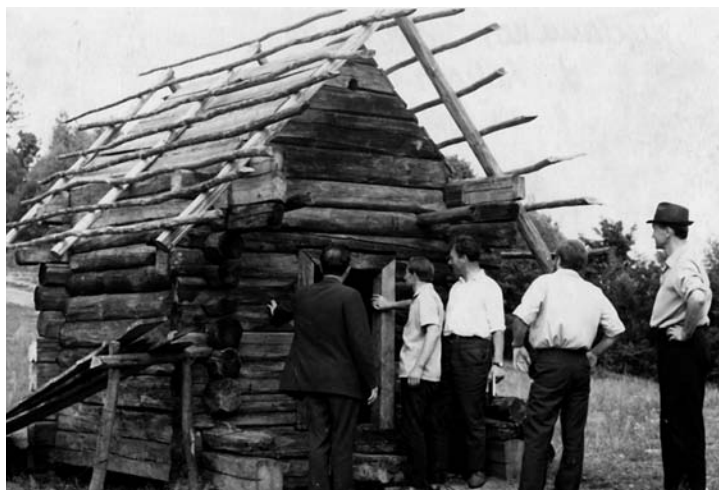
Statomas Rudaminos sodybos svirnas iš Krūminių kaimo, Varėnos rajono. 1969 m.