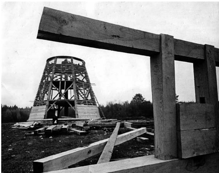
Vaivadiškių malūno iš Ukmergės rajono statyba.

geriau apdirbti medieną, naudodavo ilgesnius sienojus, žinojo tvirtesnio jų sujungimo būdus. Todėl jie namus statėsi didesnius, platesnius ir aukštesnius.