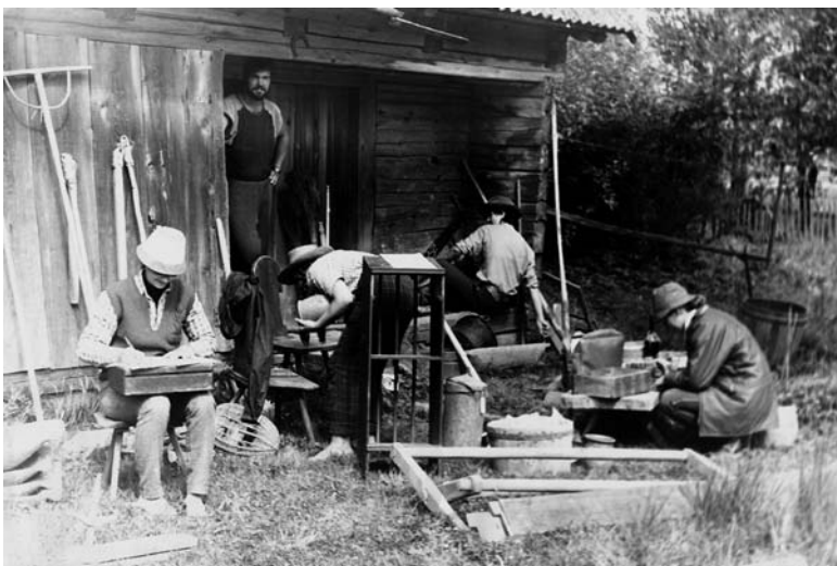
Muziejaus darbuotojai Plungės rajone, Kumžaičių kaime. 1970 m.