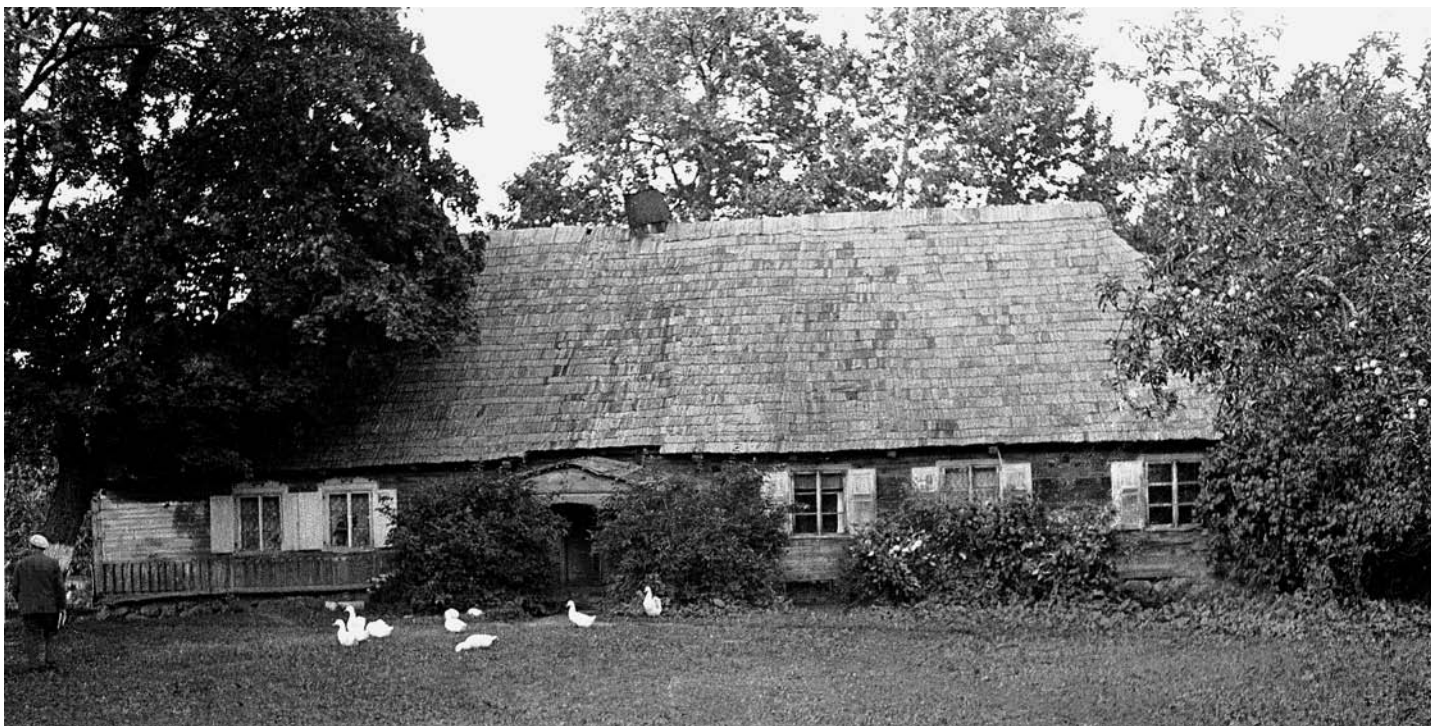
Darbėnų troba prieš perkėlimą. Maloniškių kaimas, Kretingos r. 1967 m.