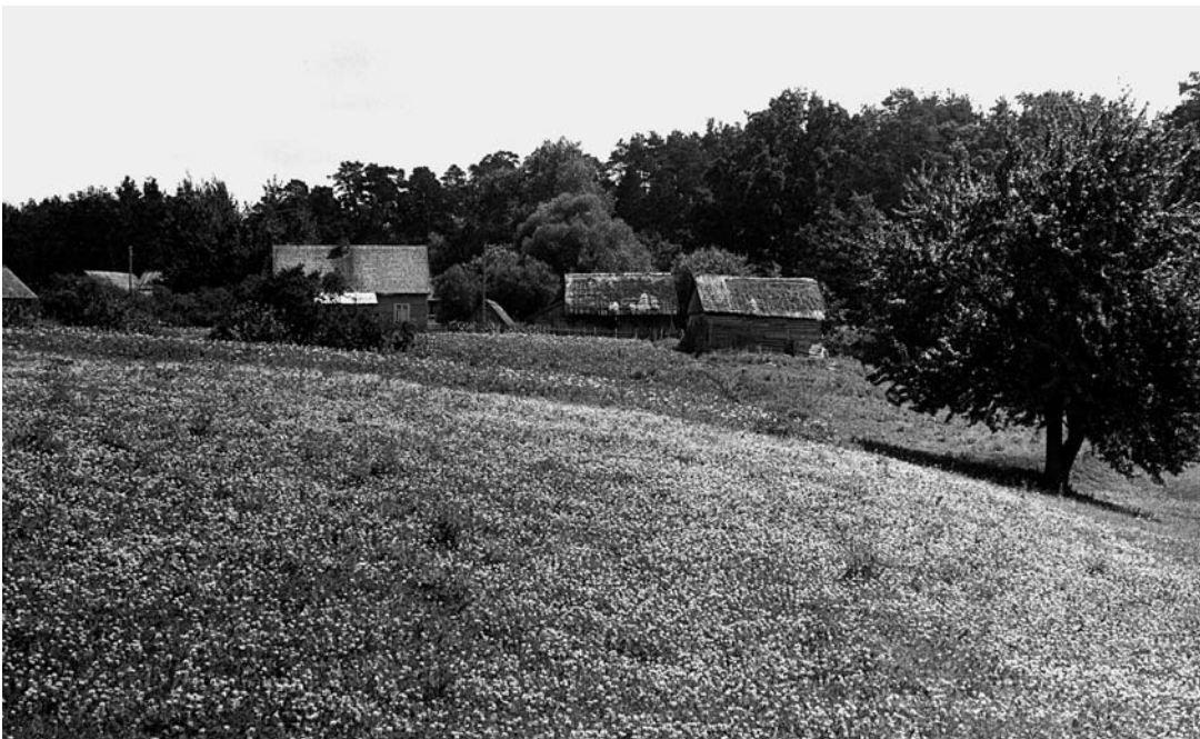
Pievelių kaimas. 1966 m.

Beje, karšti ginčai kilo ir dėl muziejaus pavadinimo. Pagal tuometinę ideologiją, sąvoka „liaudis“ apėmė toli gražu ne visus krašto gyventojus, o tik tam tikrą sluoksnį, t. y. vargstančius, išnaudojamus žmones. Dvarininkai, buožės, dvasininkai, verslininkai, kaip „liaudies priešai“, buvo tremiami ir visai spaudžiami,