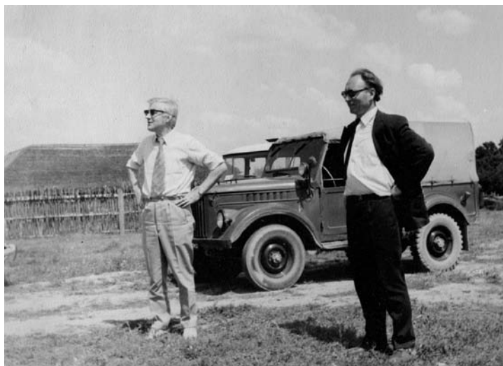
LTSR kultūros ministras Lionginas Šepetys ir Vytautas Stanikūnas.