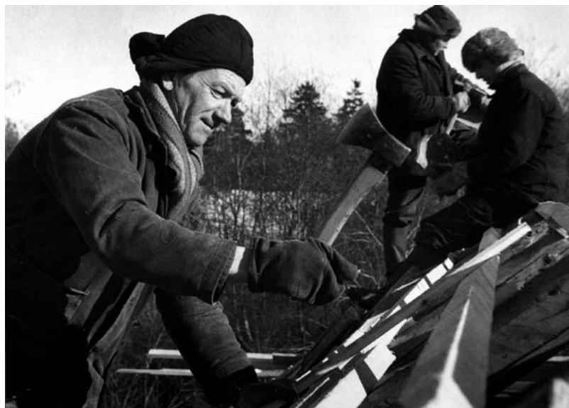
Kauno restauravimo dirbtuvių restauratoriai.