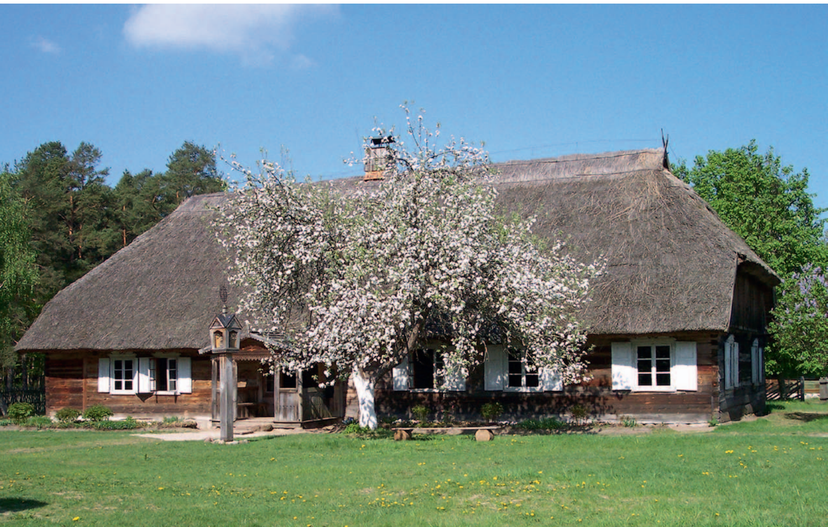
Darbėnų troba muziejuje. 2006 m.