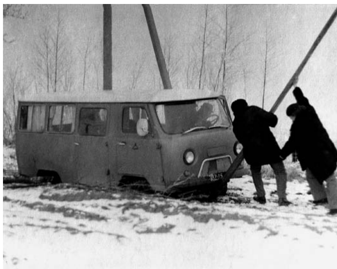
Muziejinkams atsitkdavo ir taip... Antanava, Šakių r. 1980 m.