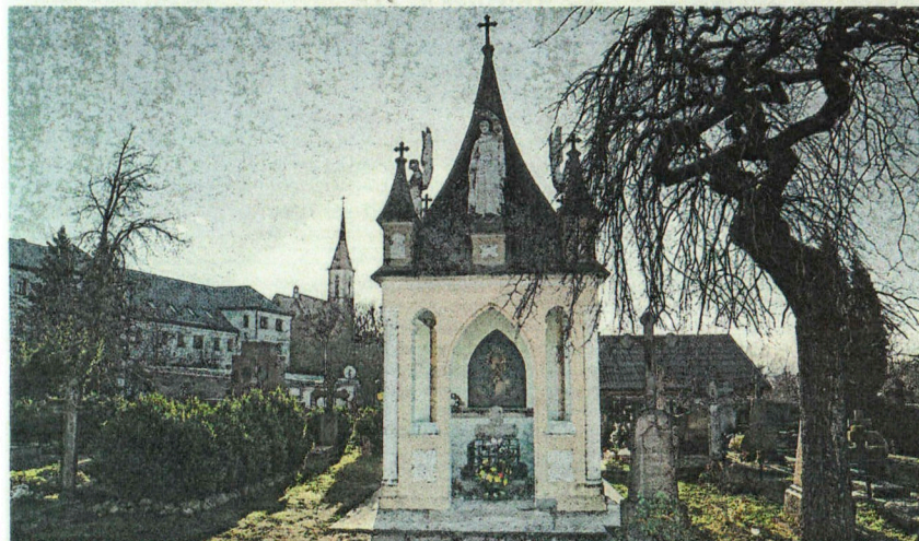
► J. Pabrėžos kapo koplyčia