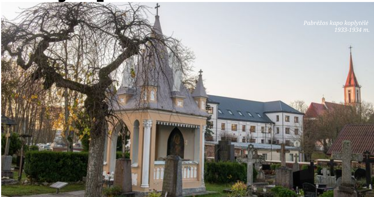
Pabrėžos kapo koplytėlė 1933-1934 m.

Jurgis Ambraziejus Pabrėža – vienas iš trijų garsiausių XIX a. Žemaitijos šviesuolių, savo darbais ir veikla stovėjęs vienoje gretoje su istoriku rašytoju Simonu Daukantu (1793–1864 m.) ir vyskupu rašytoju bei blaivybės propaguotoju