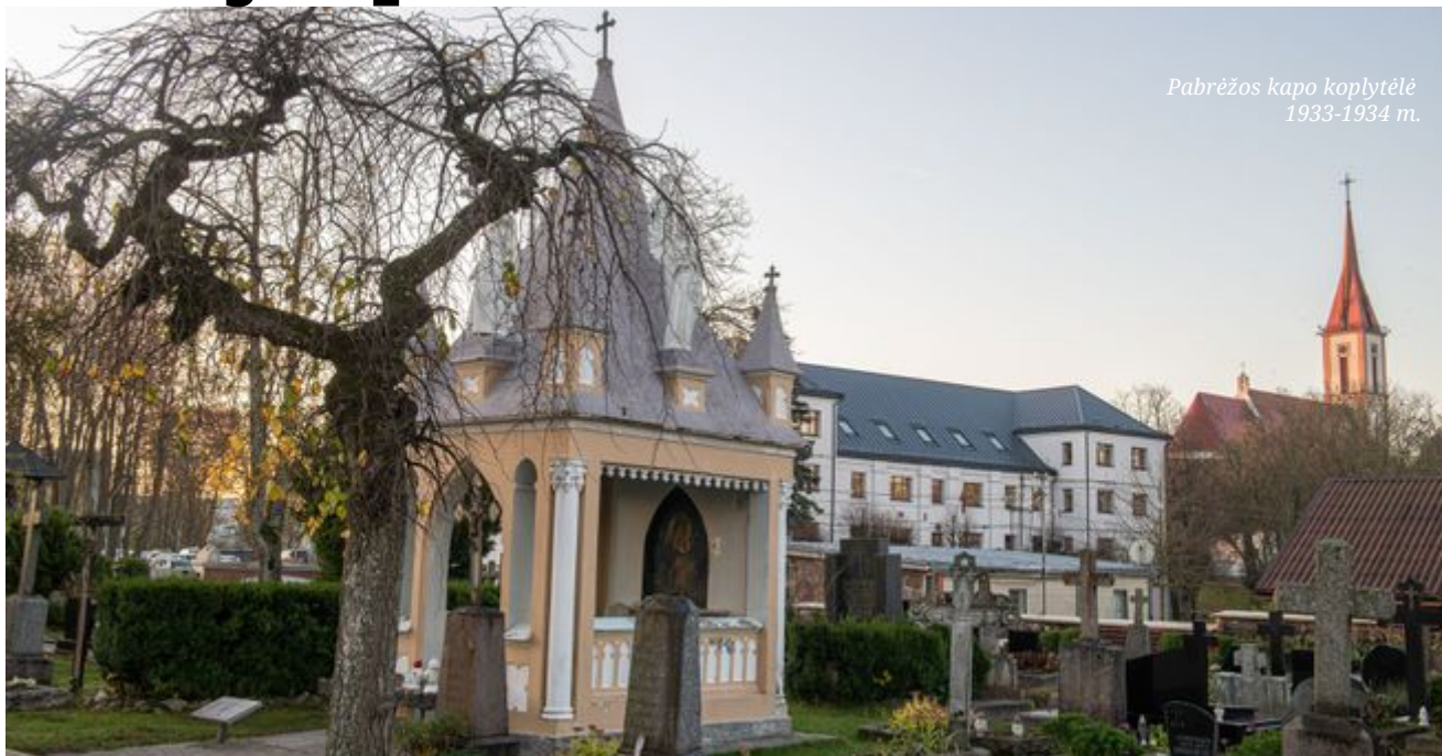
Pabrėžos kapo koplytėlė 1933-1934 m.

Jurgis Ambraziejus Pabrėža – vienas iš trijų garsiausių XIX a. Žemaitijos šviesuolių, savo darbai ir veikla stovėjęs vienoje gretoje su istoriku rašytoju Simonu Daukantu (1793–1864 m.) ir vyskupu rašytoju bei blaivybės propaguotoju