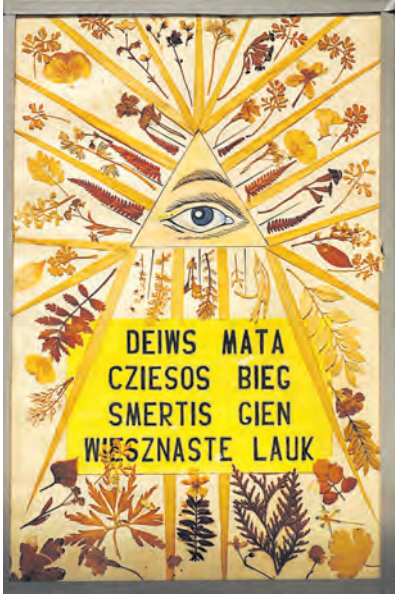
► J. Pabrėžos sukurtas paveikslas-herbariumas, kabėjęs celėje virš jo lovos. XIX a. pradžia, atnaujintas apie 1935 m.