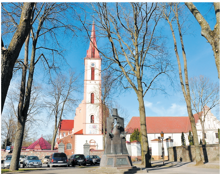
Paminklas Jurgiui Ambraziejui Pabrėžai Kretingos Viešpaties Apreiškimo Ėvė. Mergelei Marijai baņnyėios dventoriuje (skulptorius Algirdas Bosas, architektas Saulius Manomaitis)