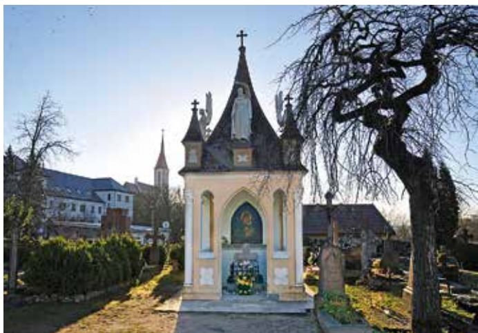
Jurgio Pabrėžos kapo koplyčia Kretingoje

1771–1849 m. Kretingoje gyvenęs kunigas aplinkiniams gyventojams turbūt labiausiai buvo žinomas ne dėl savo moks-