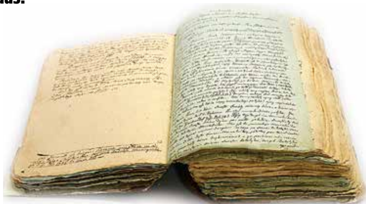
Jurgio Pabrėžos pamokslų rinkinio rankraštis

Jurgis Ambraziejus Pabrėža, kurio 250-ąsias gimimo metines šiemet minėsime, buvo ne tik kunigas vienuolis, pamokslininkas, bet ir labai didelis eruditas, mokslininkas, pirmasis Lietuvos floros tyrinėtojas. Jis išleido pirmąjį lietuvišką geografijos vadovėlį, sukūrė ir pagrindė botanikos mokslo terminiją, normino žemaičių tarmes ir kūrė bendrinę rašomąją žemaičių kalbą, išleido dvasinės literatūros ir pamokslų rinkinių, medicinos veikalų, garsėjo kaip puikus atlygio neimantis gydytojas. Seimas 2021-uosius paskelbė Jurgio Pabrėžos metais, siekdamas atkreipti dėmesį į šį iškilų XIX a. švietėją ir jo darbus.