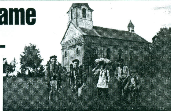
Atokvėpis prie Pakutuvėnų bažnytelės

O mažieji skautukai, paklausti, kokias savo vado savybes labiausiai vertina, atsakė: gerumą, nuširdumą, išmintį ir griežtumą.