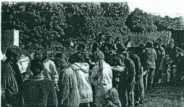
Elė prie lauko virtuvės Pakutuvėnuose vykusiųjų šeimų stovykloje.

Šeima – neįkainojama vertybė. Šeima visuomenės progresavimui jėga. Šeima – pilnutinio žmogiškumo mokykla. Šeima – „Ecclesia Domestica“. Ir taip toliau, ir panašiai mėgstama kalbėti apie šeimos instituciją katalikiškuose slukcniuose. Kalbos vis gražėja, darosi sklaidesnės ir patrauklesnės, o gyvenimo realybė išliūpi šaipos, fiksuodama santuokos ir šeimos grimasas. Grimasos varsta žaidimus. Žaidžios pradeda pūti. Atsiranda sunkimo galimybė.