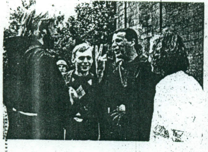
Pokalbėje su šeimos stovyklos Pakutuvėnuose vadovu.