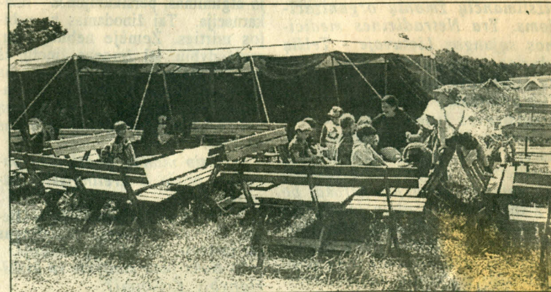
Kol tėveliai klauso paskaitų, mažieji irgi aptaria savas problemas.