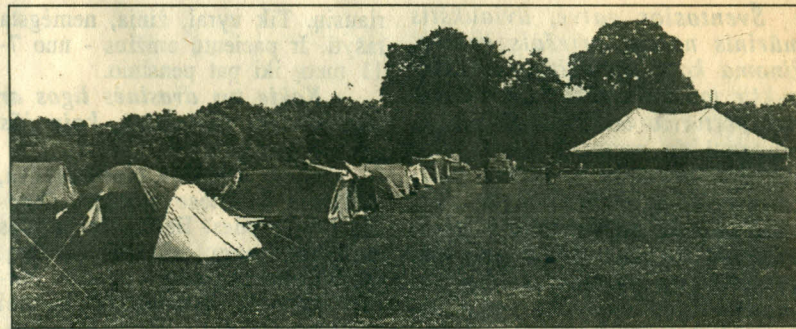
Per šeimų stovyklą Pakutuvėnuose "išdygo" ištisas palapinių miestelis.