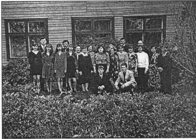
Aleksandravo pagrindinės mokyklos mokytojai su išleidžiamąja klase. 1991 m.