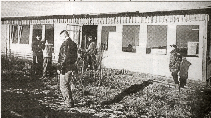
"Konteineryje" dabar gyvenantys septyni narkomanai iš Klaipėdos sakė nenorintys sulaukti žurnalistų, išstroskusių sensacijų ir besistengiančių visuose laikraščiuose tą pačią temą išjudinti, antplūdžio