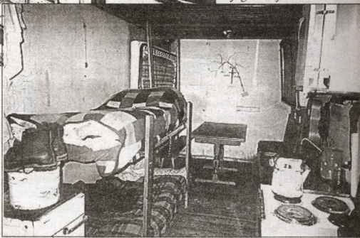
"Kambarėlyje" narkomanai patys gamina valgį

Prieglobsčiui iš pradžių buvo duota sunaikinto kaimo kapinių kopyltėlė. Nešildomose patalpose jie gyvendavo ir žiemą. Naktį miegodavo apsikabinę lauže įkaitintą akmenį. Nors ir nebuvo normalių gyvenimo sąlygų, ne vienas čia ištvėrdavo po keletą mėnesių. Ilgiausiai Pakutuvėnuose narkomanas gyveno penkerius metus.