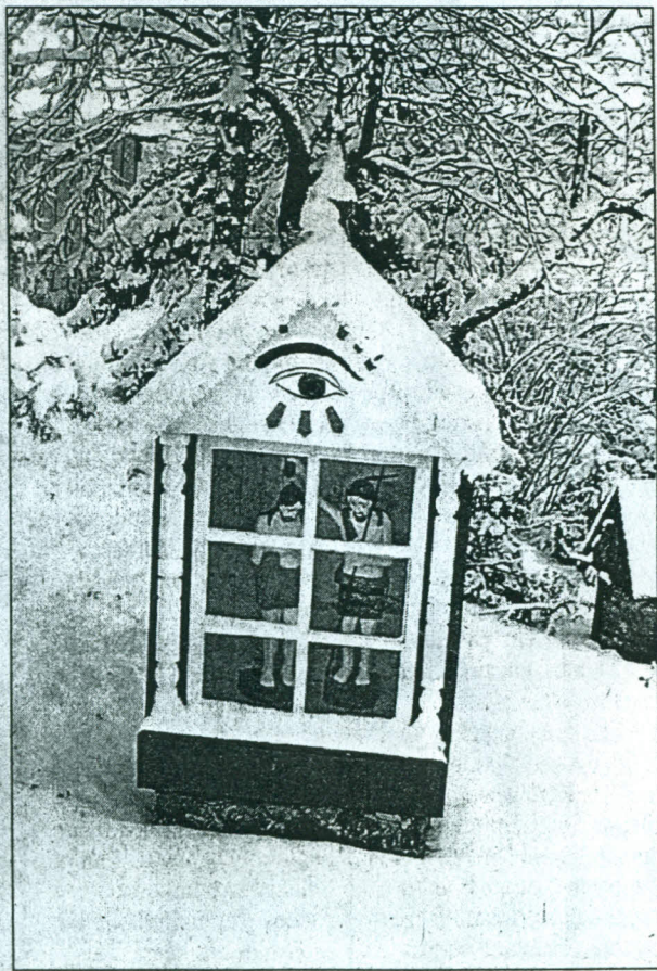
Išaušus pirmajam 2001-ųjų rytui plateliškiai pamatė, kad nebėra Antano Vaškio drožtų angeliukų...