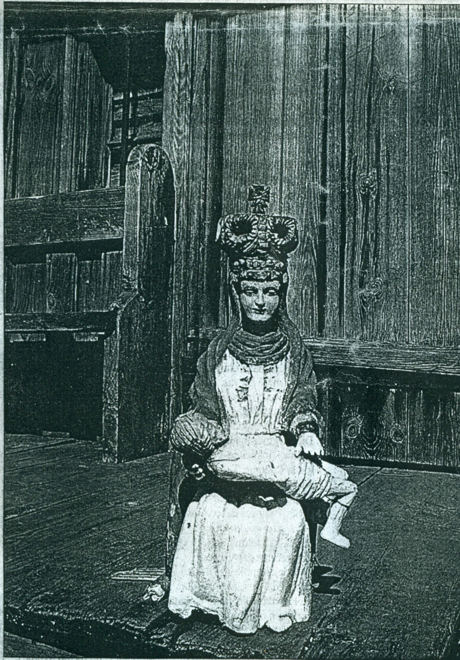
Pieta. Nežinomo dievdirbio drožta skulptūrėlė prieš porą metų buvo pavogta iš Pakutuvėnų kapinių koplyčios.

Dar ne taip seniai beklaidžiodamas po Žemaiti- ją galėjai išvysti neįtikėtino gražumo senoviškų koplytė- lių su unikaliomis šventųjų skulptūrėlėmis. Sovietmetis, aišku, buvo negailestingas ir žemaičiams. Ateistai ir čia naikino, griovė, plėšė mažosios architektūros paminklus. Kai kurių ypač vertingų skulptūrėlių pagailėjo - sumetė į muziejų saugyklas. Bet visko sunaikinti vis dėlto nepajėgė. Nuošaliose vietose, kur pikta ateisto akis nepamatė, koplytėlė išliko. Dar soviet- mečiu senieji žemaičiai nemėgo "meno mylėtojų" iš Vilniaus, Kauno ar kitų didesnių miestų. Gal prieš dvylika metų Šateikių parapijos vienkiemyje sutikta močiutė papasakojo apie nekvistus svečius, kurie kartais užklysta, klausinėda- mi, kur galėtų pasigrožėti senomis koplytėlėmis. Senolė niekada nelaukiamais svečiams nerodydavusi koplytėlių ir kaimynams patardavusi tylėti. Sako, kartą matė, kaip iš baltos "Volgos" išsiriti kleganti kompanija prie vieno koplytstulpio, stovėjusio ar ne nuo 19-o šimtmečio. Fotografavo, šūkavo, savo susizavėjimą reikšdami. Po savaitės skulptūrėlių nebeli- ko. Dar po kiek laiko dingo ir koplytstulpis... O tokie inteligentiški, malonūs žmonės "Volga" buvo