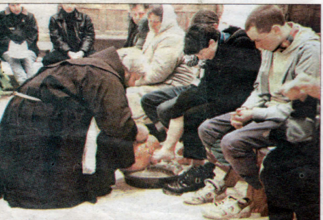
Didžiojo ketvirtadienio liturgija (2001 04 12)