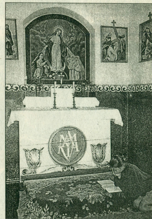
Viešvilė, 1994 m.