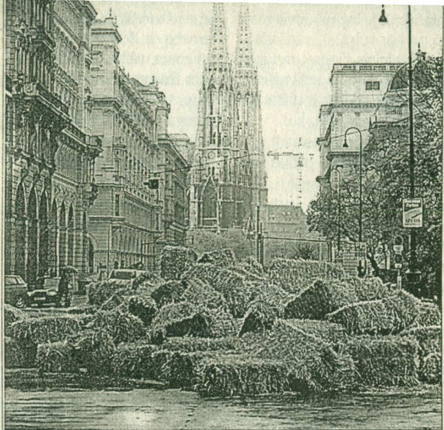
Wiena, 2001 m. pavasaris.