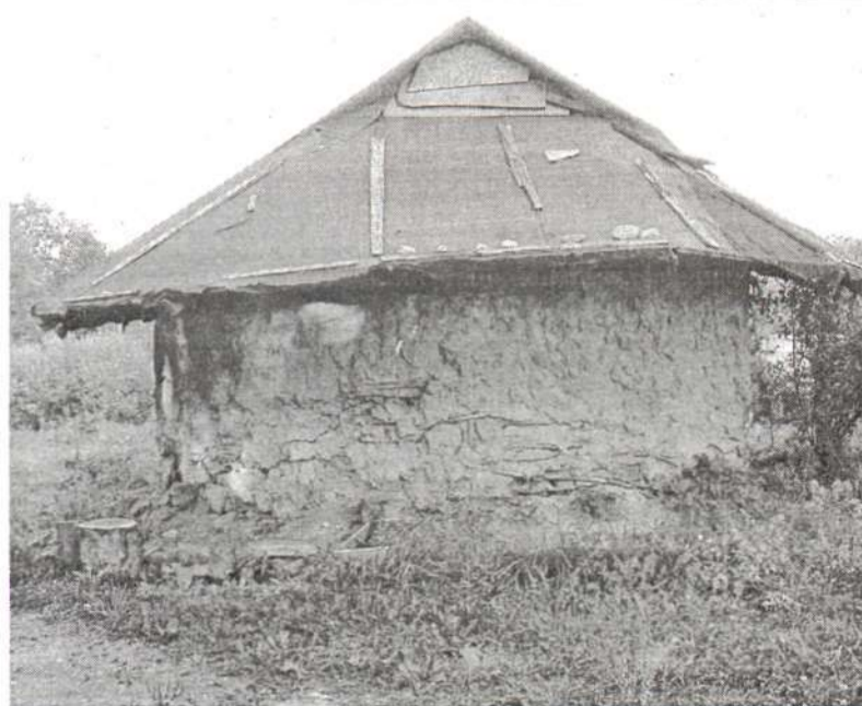
Molio namelis – bene pirmasis Pakutuvėnų statinys, kuriame, sako, ne viena geroji siela glaudžiasi. Tuščias jis nebūna, vis koks nors bendruomenės narys šiame „viešbutuke“ gyvena.