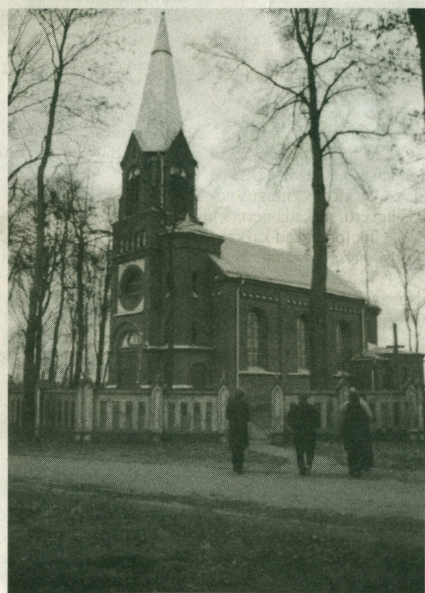
Pajūralio Šv. Joakimo bažnyčia.