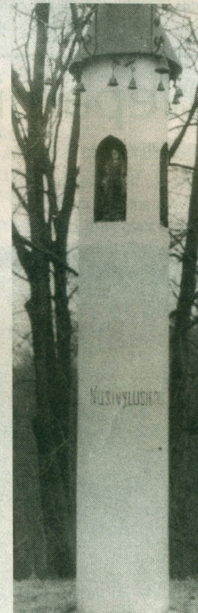
Paminklas Paberžės kapinėse.