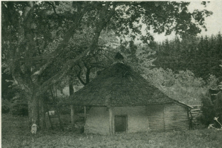
Molinis namelis Platelių miškuose.