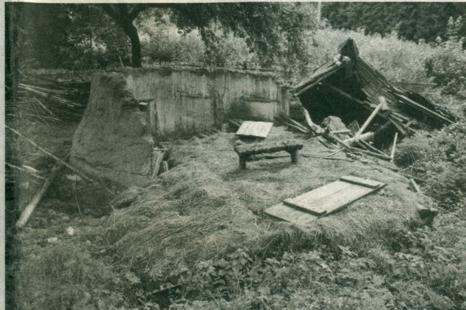
Molinis namelis Platelių miškuose dabar.