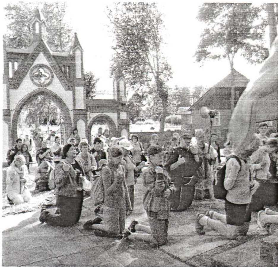
► Iš Pakutuvėnų į Kretingą keliavusi 60 piligrimų grupė atkartojė šv. Pranciškaus d