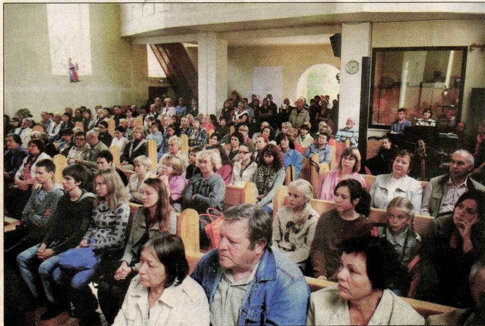
Pakutuvėnų bažnytelėje meldėsi ir jauni, vyresnio amžiaus tikintieji