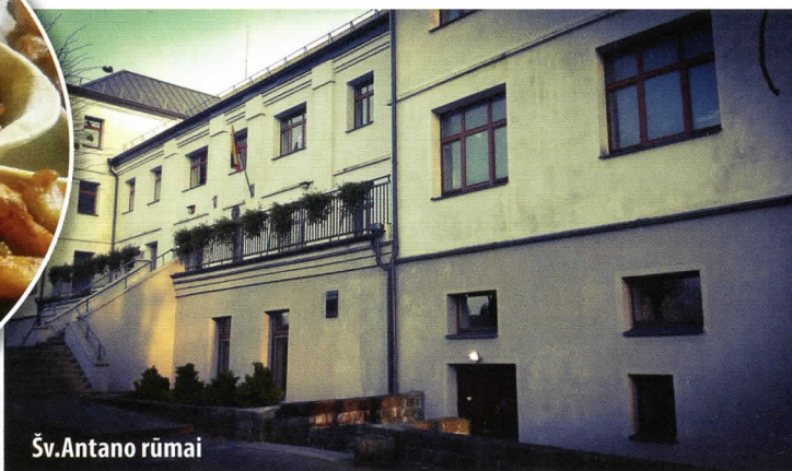
Šv. Antano rūmai