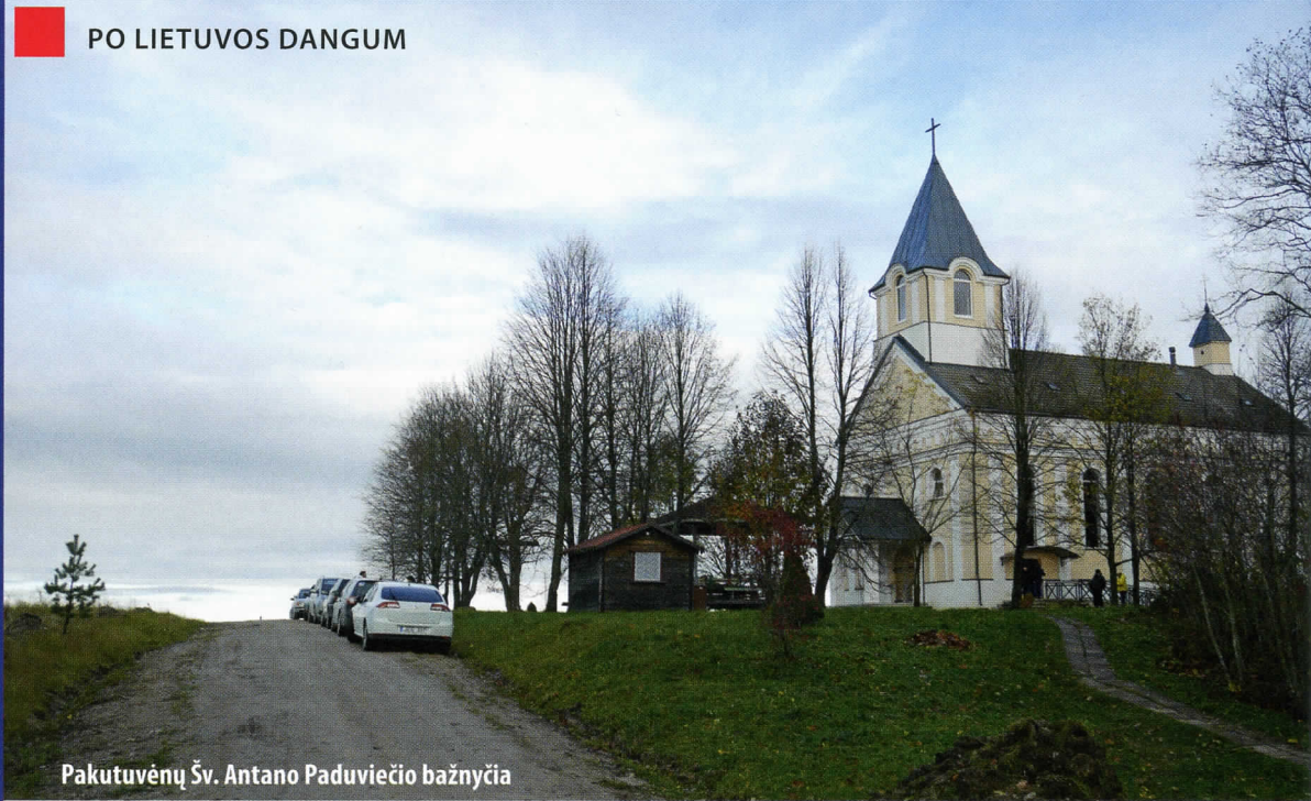
Pakutuvėnų Šv. Antano Paduviečio bažnyčia