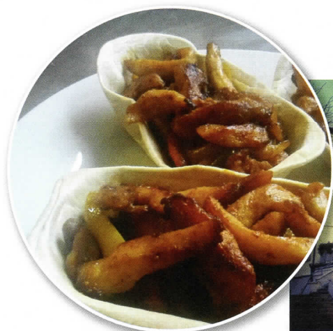
Tortilijų laiveliai